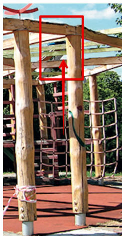
Posilňovacie prvky (hrazdy, ...)