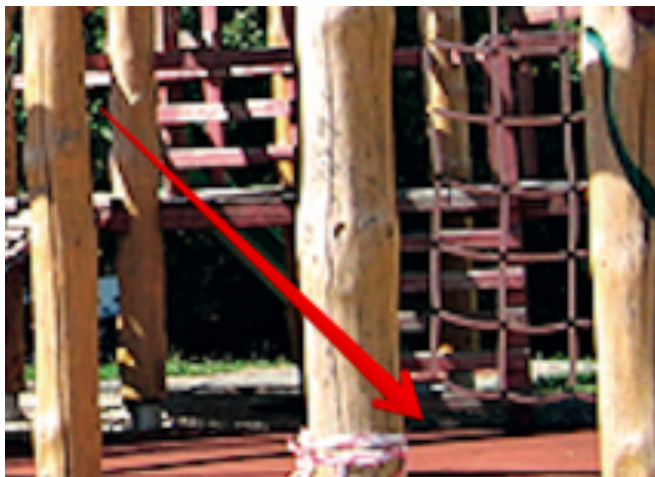
2 x Detská šmyklávka